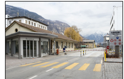
Haupteingang (Portier E1)